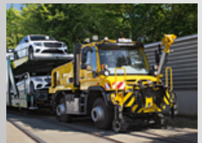
Unimog bis 1000 t Anhängelast