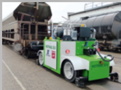
ROTRAC E4 bis 500 t Anhängelast