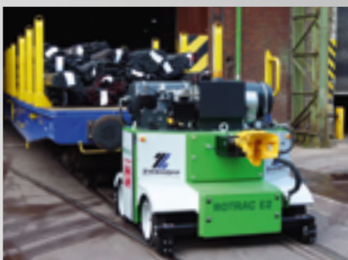
ROTRAC E2 bis 250 t Anhängelast